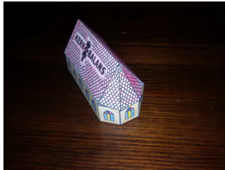
8. Lijm het dak op het schip.