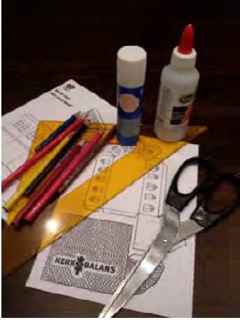
1. Benodigheden: bouwplaat, schaar, lijm of plakstift, lineaal, kleurpotloden.