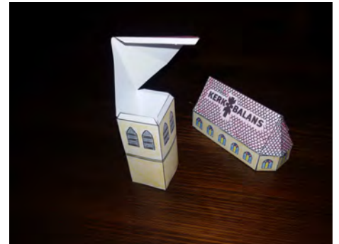
9. Lijm de onderkant van de toren.