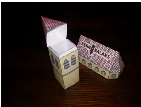
10. Lijm de torenspits en lijm vervolgens de torenspits op de onderkant van de toren.