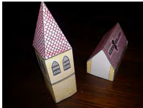
11. Lijm de toren tegen het schip van de kerk.