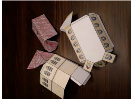
5. Vouw de vouwlijnen alvast een beetje in model.