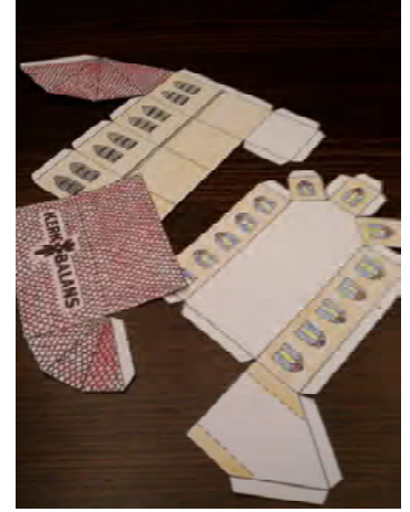
3. Knip de drie onderdelen uit: schip, dak en toren.