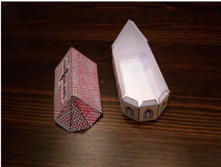
7. Lijm het dak van het schip.