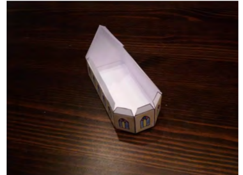
6. Lijm het schip van de kerk.